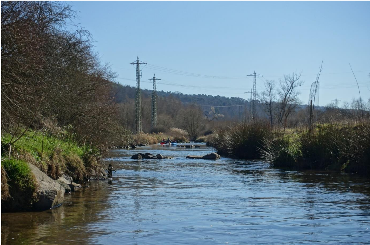
Die „renaturierte“ Strecke bei Lampertsmühle

Es wurden bewusst nur Bilder ausgewählt auf denen die abgebildeten Personen ohne Zusatzwissen nicht erkennbar sind.